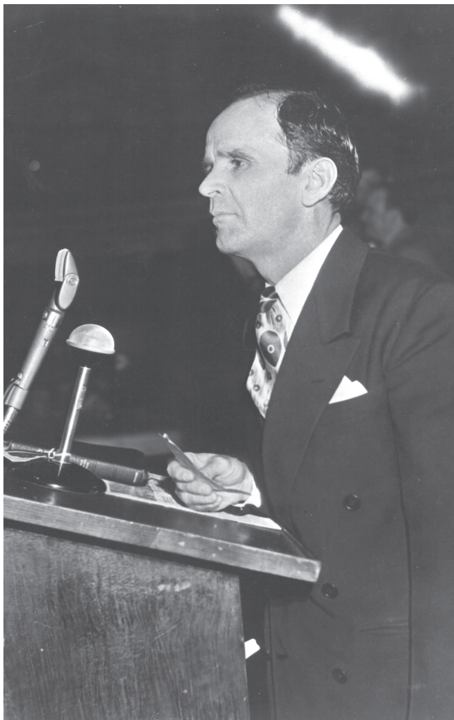
William Marrion Branham